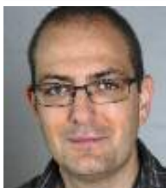
Erne David Schulleiter Städtli 2