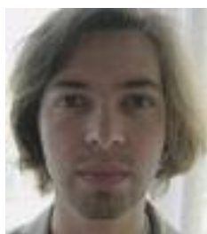
Bieri Gaudens Klavier/Keyboard/ Korrepetition