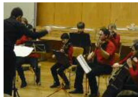
Streicherorchester 2. Februar 2011