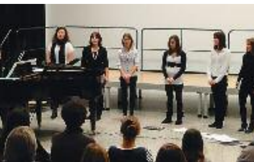
Konzert «the Sopranos» 1. Februar 2011