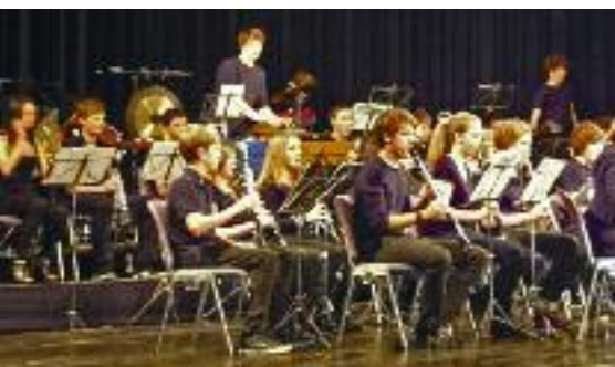
Konzert Blasorchester 26. Januar 2011

Impressionen verschiedener Anlässe der Musikschule Cham im Januar 2011