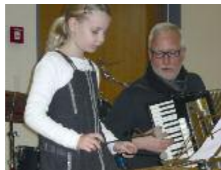
Eltern-Kind-Musizieren 29. Januar 2011